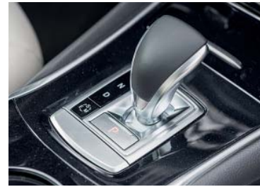
Joystick Designer-Schalthebel. Drei Fahrmodi stehen zur Wahl.

lage, die der eines Sportwagens in nichts nachsteht. Bemerkenswert auch die gezielten Eingriffe des ESP, das über die 1745 Kilo wacht. Einziger Wermutstropfen, der Q30 verfügt über eine etwas harte Federung.