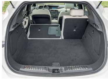
Durchschnitt Der Kofferraum ist nicht sehr gross und die Variabilität ist beschränkt.