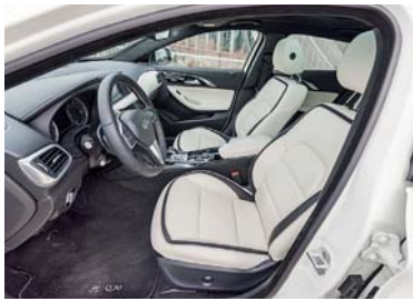
Einladend Vorne ist es geräumig und die Nappaledersitze sind extrem verführerisch.