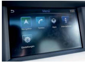
7-Zoll-Bildschirm mit mehreren Apps. Steuerung durch Berührung oder Stellrad

Dies gilt auch für das Fahrverhalten. Der leicht höher gelegte Q30 tauscht die spielerische Seite eines Kompakten gegen eine schwungvolle, aber die Sicherheit in den Vordergrund stellende Strassenlage. Auch wenn man es in Anbetracht der Vorgänger der Marke pfiffiger erwartet hätte, erweist sich das Auto als ausgewogen und zeigt keinerlei Schlingern. Die präzise Lenkung trägt zur Effizienz bei. Nicht zu vergessen der Allradantrieb mit Mehrscheibenkupplung, der die Traktion brillant regelt. So gut, dass der Q30 keinerlei Durchdrehen der Räder kennt. Und dann die sowohl kräftige, als auch progressive Bremsan-